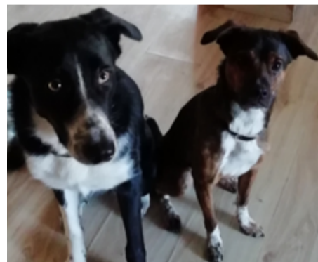
La presencia de una mascota puede mejorar el estado de ánimo y reducir los sentimientos de ansiedad y estrés