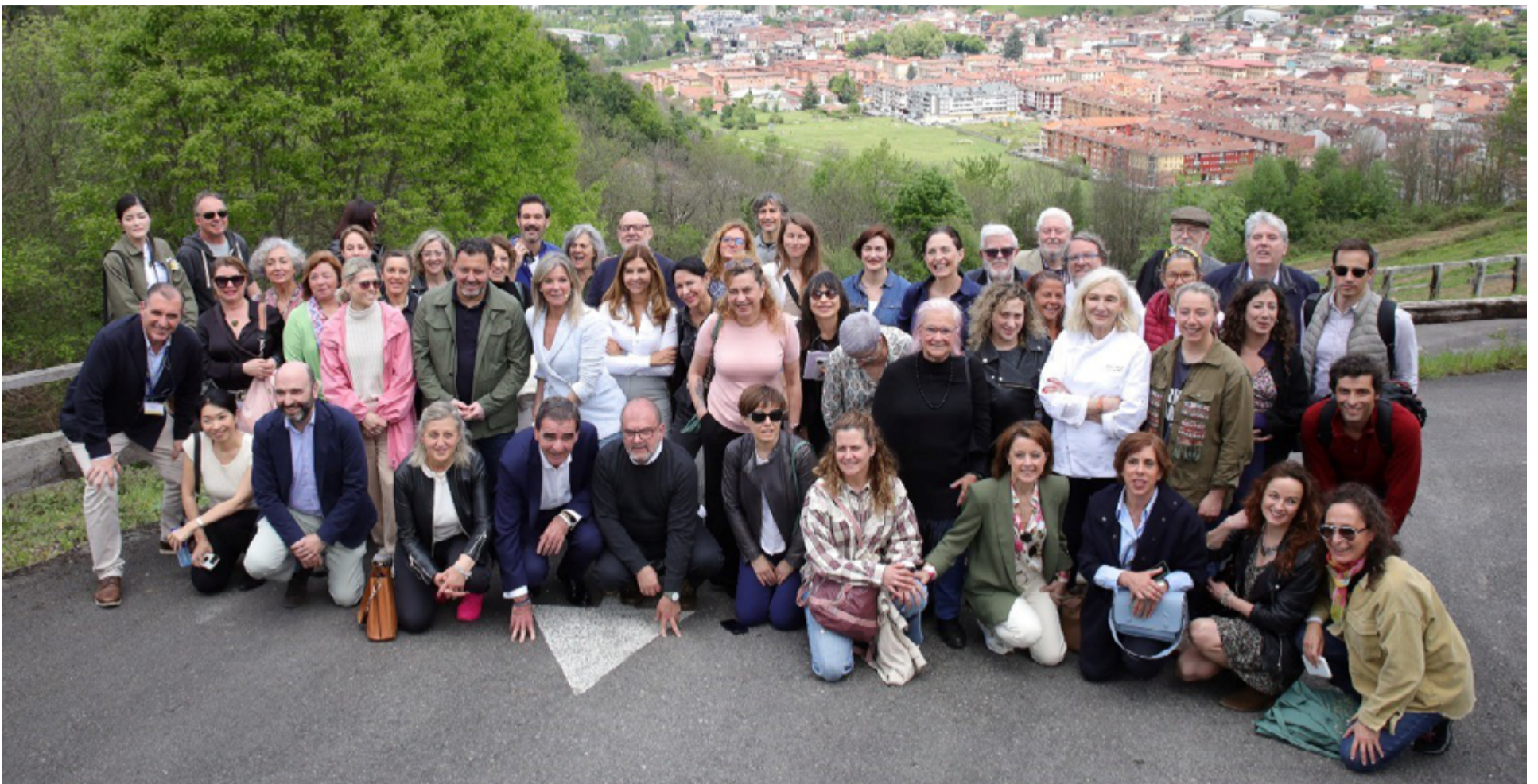
Foto de familia de los participantes en el congreso