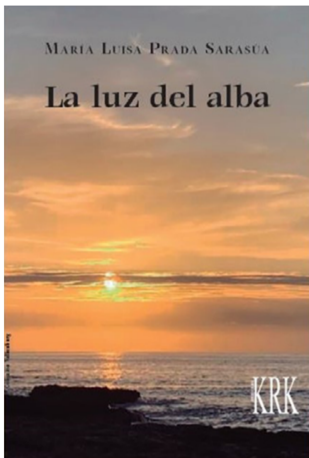
Portada del libro

La undécima obra de la escritora comienza en Mieres en una noche de San Juan