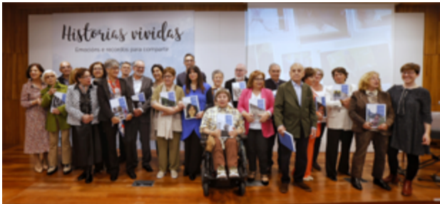
Participantes y organizadores de la iniciativa

En esta edición, 16 personas escribieron un libro de vida, que se les entregó en presencia de familiares y amigos