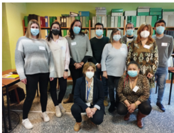
Participantes en el programa mixto

Así, por ejemplo, aprenderán a prestar apoyo a las personas mayores y/o dependientes en las distintas actividades de su vida diaria como movilizaciones, higiene o alimentación. También se formarán para poder comunicar-