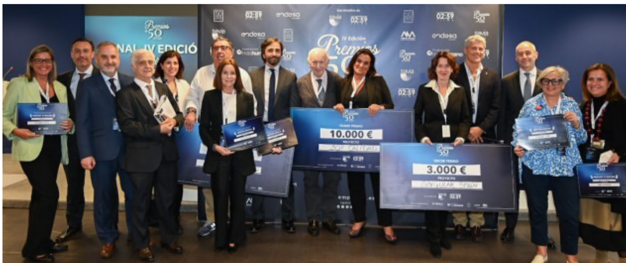
Foto de familia de ganadores y organizadores

Menciones especiales para Cincuentaer y SeniorsLeading