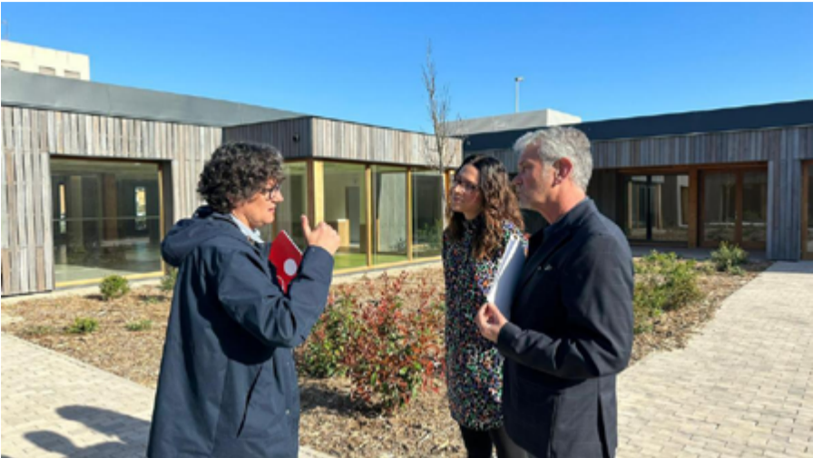
El Centro es uno de los más "vanguardistas" de la Comunitat Valenciana.

Meliana acogerá la mayor construcción permanente realizada en España con balas de paja